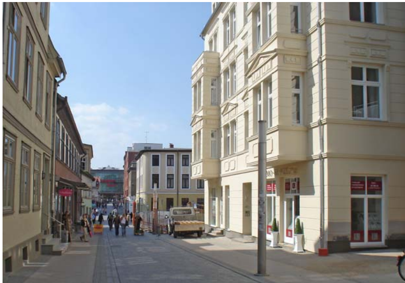
Schlossstr. - Blick auf Schloßparkcenter

Schwerin, mit ca. 96.000 Einwohnern die wohl kleinste Landeshauptstadt der Bundesrepublik. Unweit der Metropole Hamburg gelegen finden Sie hier Ruhe und idyllische Landschaften. Auch die Ostsee ist in kurzer Zeit mit dem Auto zu erreichen. Hier entstehen topp sanierte Eigentumswohnungen mitten im Zentrum von Schwerin. Die Wohnungen liegen in absolut bester Innenstadt-Lage von Schwerin, sind Altersgerecht, barrierefrei und hochwertig ausgestattet Eine Beratung bzw. Besichtigung der Wohnungen ist jederzeit von Montag bis Sonntag in der Zeit von 8.00 Uhr bis 20.00 Uhr nach Absprache möglich.