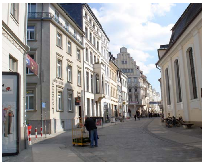
Schlossstr. – Richtung Schloß und Schweriner See