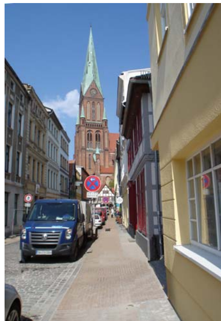
Buschstr.- Blick zum Dom