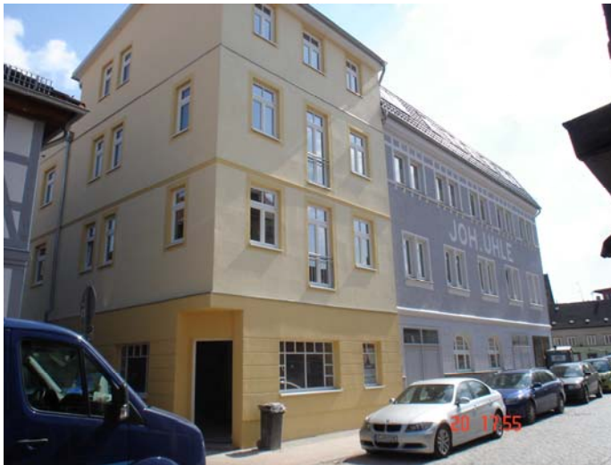
Ecke Engestr.- Buschstr.